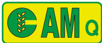
图三：农机产品安全认证