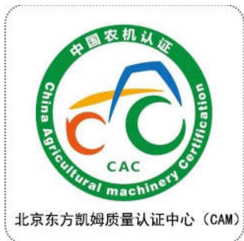
图 1：产品认证标志样式

涉及 CNCA-AM-01:2018 《农机自愿性产品认证实施规则 通用要求》中的产品认证标志由基本图案和认证机构标志识别信息组成。如图所示：